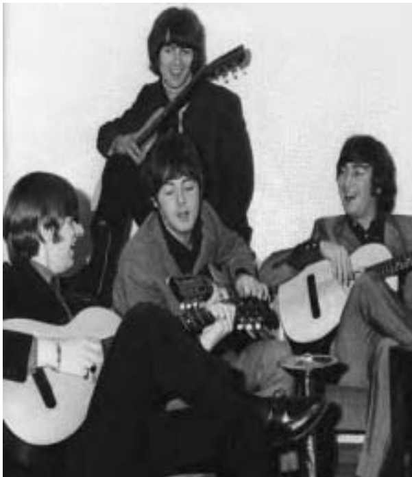
Alle Beatles mit akustischen, russischen Gitarren. Ein Geschenk der russischen Botschaft in London.