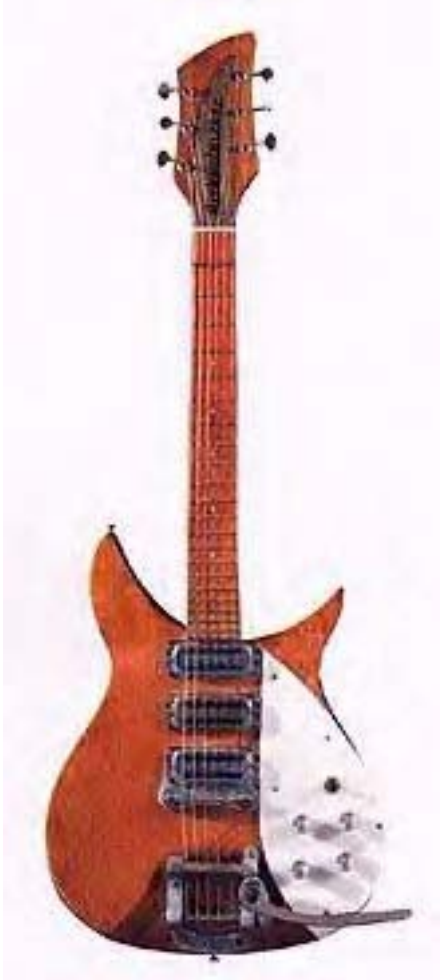
58'er 325 - Capri