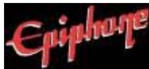
Epiphone Casino E 230 TD