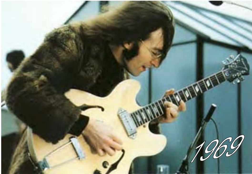
John's Epiphone jetzt geschliffen und mit Mattlack versehen, beim letzten öffentlichen Auftritt der Beatles auf dem Dach des Apple-Gebäudes am 30.01.1969.