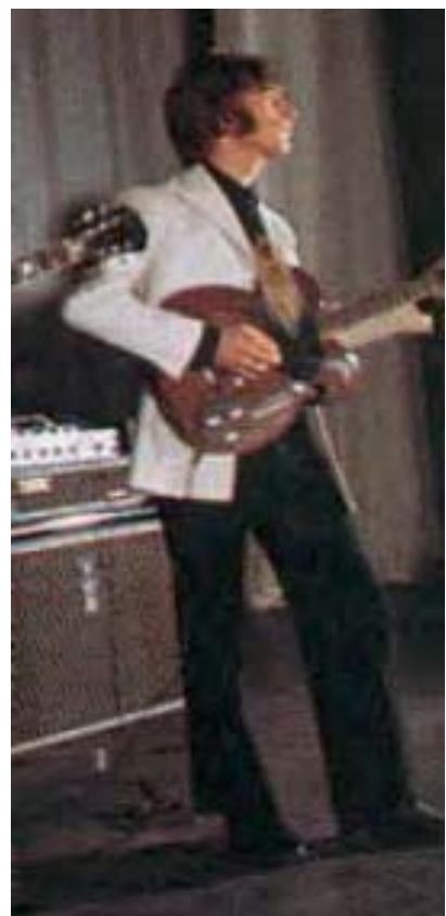
1967 mit VOX Gitarre