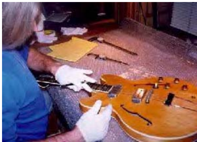
.....und beim Restaurator