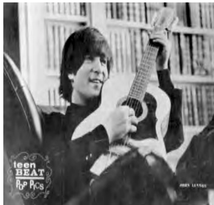
mit 12 saitiger Framus im Film „A Hard Days Night“